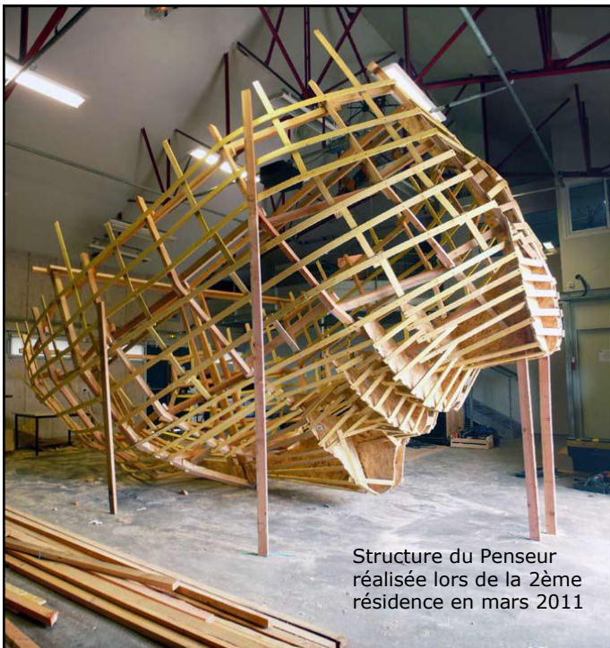
Structure du Penseur réalisée lors de la 2ème résidence en mars 2011